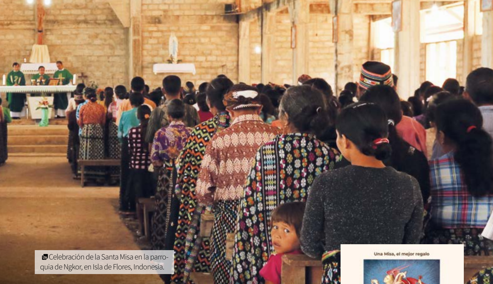
📹 Celebración de la Santa Misa en la parroquia de Ngkor, en Isla de Flores, Indonesia.

Los Novenarios y las Gregorianas suelen celebrarse sacerdotes de seminarios, casas de formación y monasterios contemplativos en países de necesidad. Los donativos recibidos sirven para hacer frente a los gastos de sostenimiento de estos centros durante varios meses. ¿No es gratificante saber que a la vez que se ofrecen Misas por el alma de nuestros difuntos, fomentamos las vocaciones y ayudamos a sostenerse a los monasterios de vida contemplativa que tanto rezan por nuestras intenciones?