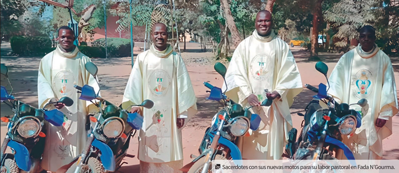
Sacerdotes con sus nuevas motos para su labor pastoral en Fada N'Gourma.

A pesar de ello, siguen trabajando incansablemente por el pueblo que sufre.