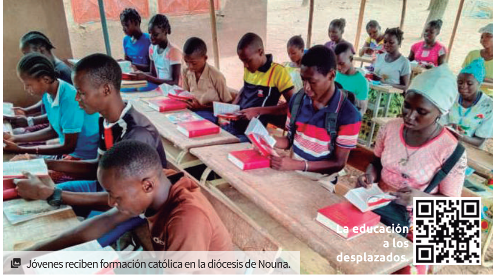
Jóvenes reciben formación católica en la diócesis de Nouna.

“Tenemos miedo. No queremos que recluten a nuestros hijos. Rogamos a