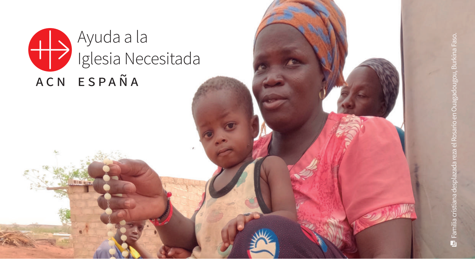
Familia cristiana desplazada reza el Rosario en Ouagadougou, Burkina Faso.